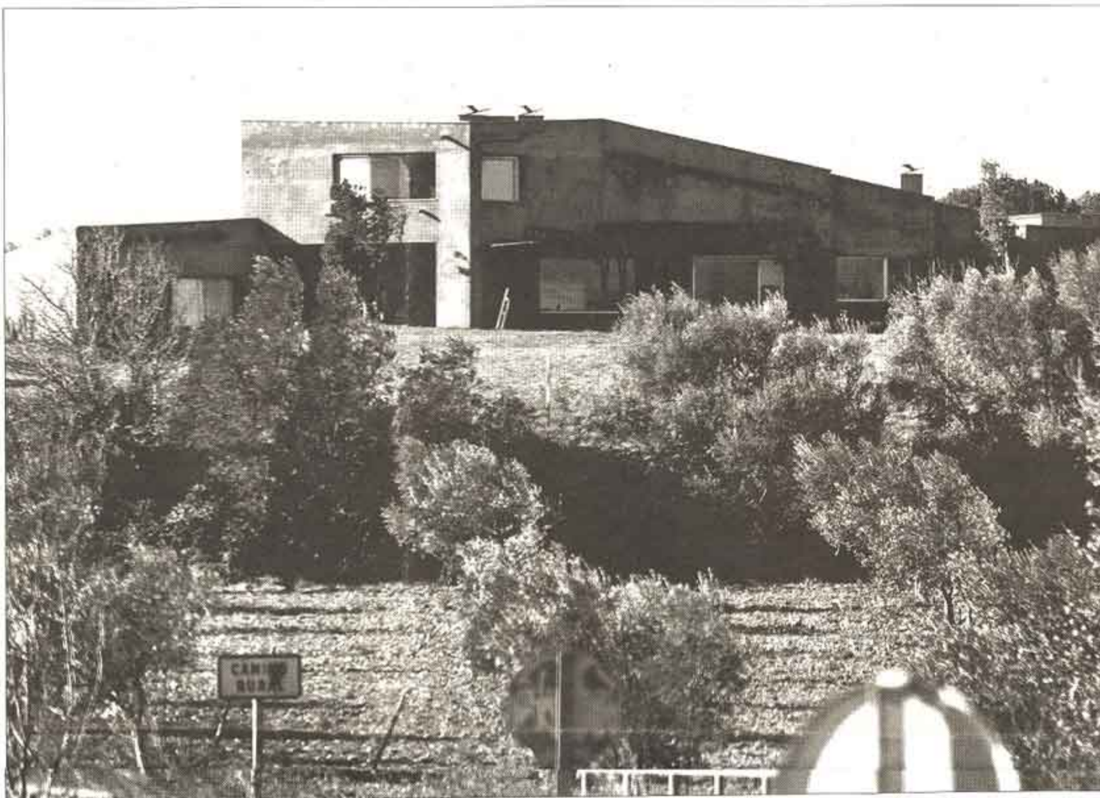
El jurat dels premis d'arquitectura ha valorat la integració de l'immoble en el paisatge rural.

Els Premis d'Arquitectura de les Comarques de Girona, convocats per primera vegada l'any 1997, responen a "la voluntat de valorar i divulgar la bona